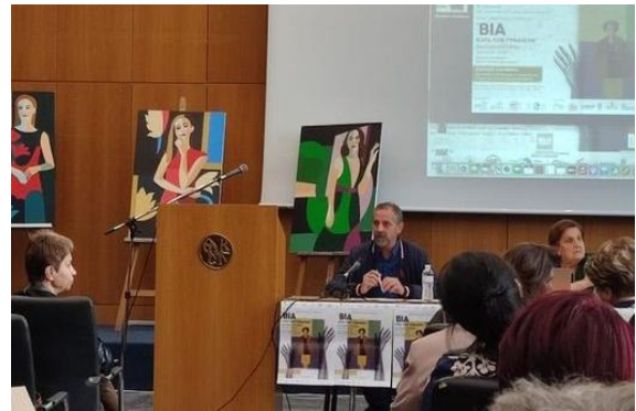
Ημερίδα με θέμα: "Βία κατά των γυναικών", Θεσσαλονίκη, 7/11/2022