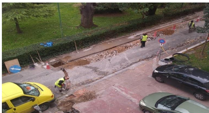
Τεχνικές εργασίες για την όδευση οπτικής ίνας στο κτίριο της Κεντρικής Υπηρεσίας του Ε.Κ.Κ.Α. (ΣΥΖΕΥΞΙΣ II)