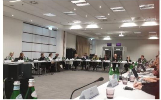
Συνάντηση Εθνικών Συντονιστών, Βερολίνο, 27 & 28/09/2022