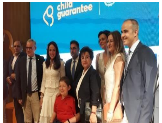
Ημερίδα «Ακούμε τη φωνή των παιδιών», Τεχνόπολη, Αθήνα, 07-06-2022