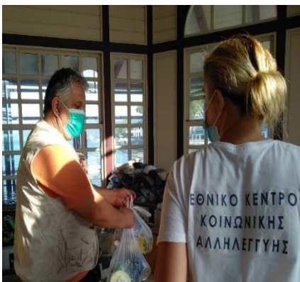
Κλιμάκιο Ε.Κ.Κ.Α. στις πυρκαγιές της Β. Εύβοιας, Αύγουστος 2021

Σε περιπτώσεις μαζικών καταστροφών και ατυχημάτων με μεγάλο αριθμό θυμάτων, το Ε.Κ.Κ.Α. είναι πάντα κοντά στον συνάνθρωπο στις μεγάλες τραγωδίες για την παροχή άμεσης κοινωνικής και ψυχολογικής στήριξης, μέσω Ομάδων Ταχείας Παρέμβασης, που στελεχώνονται εξειδικευμένο προσωπικό, κοινωνικούς λειτουργούς και ψυχολόγους.