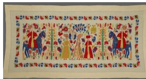
Κέντημα «Ηπειρώτικος γάμος»