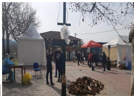
Κλιμάκιο Ε.Κ.Κ.Α στους σεισμούς της Λάρισας, Μάρτιος 2021

Το 2021 οι Ομάδες Ταχείας Παρέμβασης κινητοποιήθηκαν για παροχή ψυχοκοινωνικής υποστήριξης στους πληγέντες από τους σεισμούς στην περιοχή της Λάρισας (Μάρτιος), από τις φονικές πυρκαγιές στην Εύβοια (Αύγουστος) και τις πλημμύρες που ακολούθησαν τον Οκτώβριο.