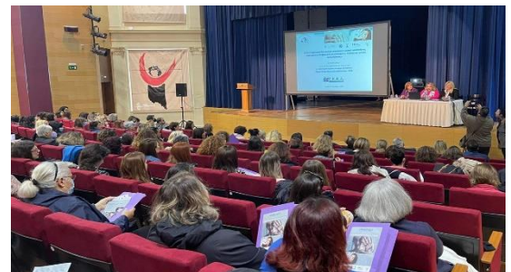
25/11/2022: Ημερίδα στα Χανιά