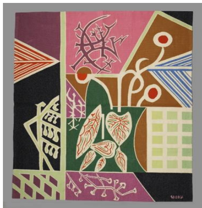
Ταπισερί «Καφάσια σε κήπο», σχέδιο του Χατζηκυριάκου-Γκίκα

Το Ε.Κ.Κ.Α., καθολικός διάδοχος του πρώην ΙΚΠΑ, – μετά την συγχώνευση του ν. 3895/2010 ΦΕΚ- Α' 8/12/2010 – έχει στην κυριότητά του αδιάθετο υλικό έτοιμων προϊόντων και πρώτων υλών της Οικοτεχνίας, βασικής δραστηριότητας του πρώην ΙΚΠΑ που λειτουργούσε ως το 2010.