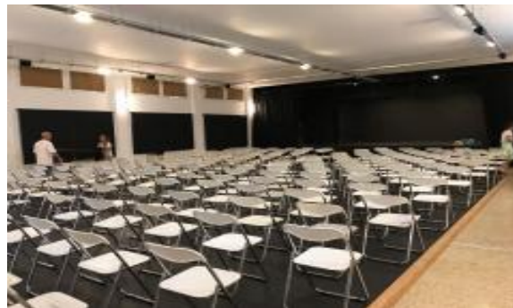
Πολυχώρος Πολιτισμού «ΦΟΙΝΙΚΑΣ»