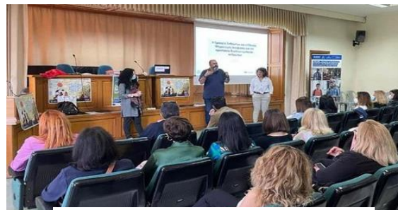
Ενημερωτική Συνάντηση ΕΜΑ, Κατερίνη, 17/05/2021

Η υλοποίηση του θεσμού από το Ε.Κ.Κ.Α. υποστηρίζεται οικονομικά από το Ευρωπαϊκό Ταμείο Εσωτερικής Ασφάλειας στο πλαίσιο του έργου «Ε.Μ.Α. - Ενίσχυση του Εθνικού Μηχανισμού Αναφοράς για την Προστασία Θυμάτων Εμπορίας Ανθρώπων», του οποίου εγκρίθηκε και η παράταση έως 31/12/2023.