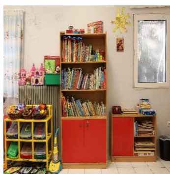
Χώρος δραστηριοτήτων για παιδιά στον Ξενώνα Αττικής.