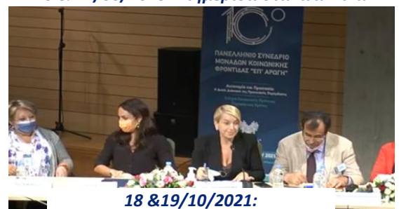
18 & 19/10/2021: 10ο Συνέδριο Επ' Αρωγή