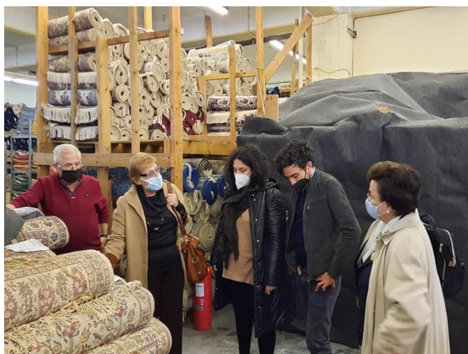
Παρακολούθηση απογραφής των ειδών Οικοτεχνίας από την Πρόεδρο και μέλη του Δ.Σ.