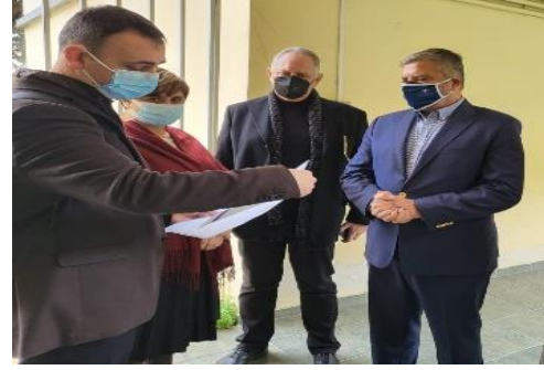
Επίσκεψη ΠτΔ Κ. Σακελλαροπούλου και της Υφυπουργού Δ. Μιχαηλίδου σε Ξενώνα θυμάτων ενδοοικογενειακής βίας & trafficking του ΕΚΚΑ, 29/4/2021