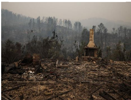
Εικόνα από την πυρκαγιά της Β. Εύβοιας

Τον Ιούλιο 2022 , οι Ομάδες Ταχείας Παρέμβασης κινητοποιήθηκαν για τη στήριξη των πληγέντων από την πυρκαγιά της Ανατολικής Αττικής .