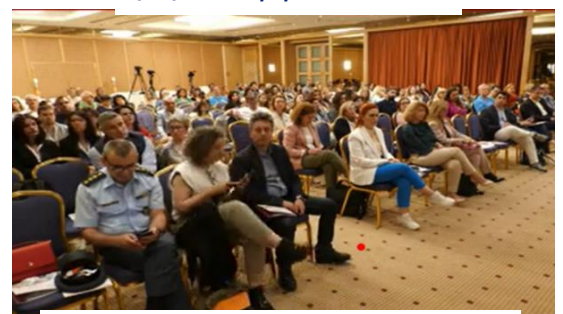
16 & 17/06/2023: Διημερίδα στα Ιωάννινα