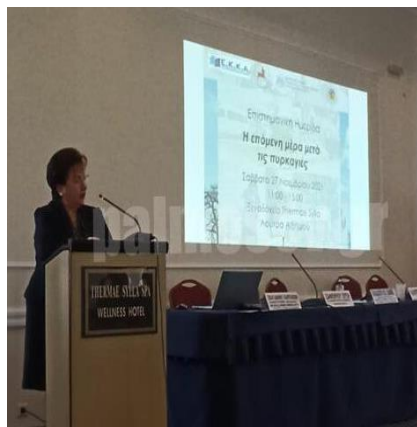
Χαιρετισμός της Προέδρου του Ε.Κ.Κ.Α. στην Ημερίδα, Λ. Αιδηψού, 27/11/2021

Ειδικά, για τις επιπτώσεις στην οικονομική και ψυχοκοινωνική ζωή των πληγέντων από την ακραία καταστροφική πυρκαγιά της Β. Εύβοιας, το ΕΚΚΑ διοργάνωσε Ημερίδα με θέμα: « Η επόμενη μέρα μετά τις πυρκαγιές », σε συνεργασία με το Πανεπιστήμιο Θεσσαλίας ( 27/11/2021 ), στα Λουτρά Αιδηψού.