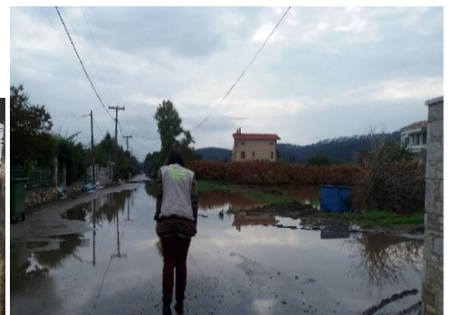
Κλιμάκιο Ε.Κ.Κ.Α. στις πλημμύρες της Β. Εύβοιας, Οκτώβριος 2021