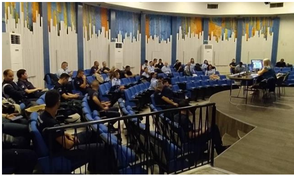
Εκπαίδευση προσωπικού της ΕΛ.ΑΣ. από το Ε.Κ.Κ.Α. για την Ποινική Διαμεσολάβηση, Αθήνα, 28/09/2022