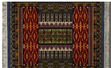
Χαλί σε σχέδιο του Χατζηκυριάκου-Γκίκα

Χαλιά, εργόχειρα και ταπισερί ανεκτίμητης αξίας, από εγχώριες ίνες με φυσικά χρώματα και ελληνικά σχέδια βγαλμένα μέσα από την παράδοση, αποτελούν έναν «θησαυρό» χειροτεχνημάτων. Ταπισερί παρουσιάστηκαν σε εκθέσεις του MOMus στον Βόλο & στη Θεσσαλονίκη.