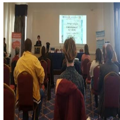
Ημερίδα «Η επόμενη μέρα μετά τις πυρκαγιές», Λ. Αιδηψού,

Στην ημερίδα συμμετείχαν επιστήμονες πολλών ειδικοτήτων (Καθηγητές Πανεπιστημίου, Δασολόγοι, Μηχανικοί, Εκπαιδευτικοί, Ψυχολόγοι), οι οποίοι με τις εισηγήσεις τους εστίασαν στην εκτίμηση των συνεπειών και συζητήθηκαν προτάσεις για ουσιαστική ανάκαμψη της περιοχής.