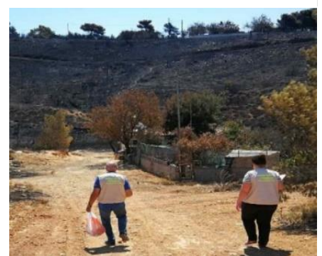
Κλιμάκιο Ε.Κ.Κ.Α. στις πυρκαγιές της Αν. Αττικής, Ιούλιος 2022

Τον Μάρτιο 2023 , συμμετείχαν δύο κλιμάκια, από Αθήνα & Θεσσαλονίκη, στο σιδηροδρομικό δυστύχημα στα Τέμπη .